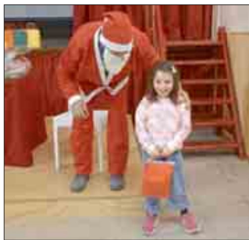
Nelle foto, diversi momenti della festa della Policoro Academy