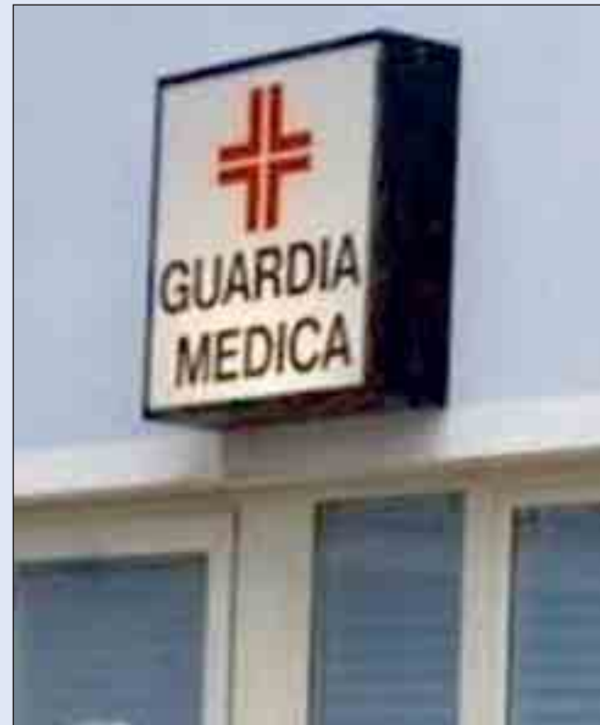
La sede di una guardia medica

POTENZA - Tra Covid e influenza sono sempre più i lucani alle prese con febbre, tosse e raffreddore. Dal consueto monitoraggio del venerdì del ministero della Salute sul fronte Covid arrivano dati contrastanti per la Basilicata: i contagi risultano in calo di quasi il 20% nella settimana che va dal 21 al 27 dicembre, con 115 nuove infezioni contro le 140 del monitoraggio precedente, ma continua a salire il numero dei ricoveri. 49 i pazienti in ospedale tra il San Carlo di Potenza e il Madonna delle Grazie di Matera (di cui uno in terapia intensiva), nove in più rispetto alla scorsa settimana, un dato che nel 2023 non si era mai visto e che dimostra come soprattutto nei confronti di anziani e fragili anche le nuove varianti Covid possano creare problemi tali da rendere necessario