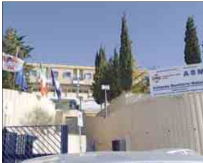
A sinistra la sede dell'azienda sanitaria locale di Matera