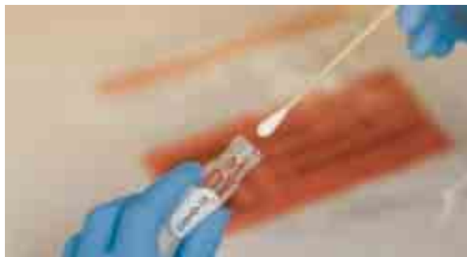
Tamponi per rilevare il virus da Covid. A PAGINA 5

Domani accesso senza prenotazione nei Punti Vaccinali Territoriali del Materano Nel capoluogo somministrazioni dal 2 gennaio