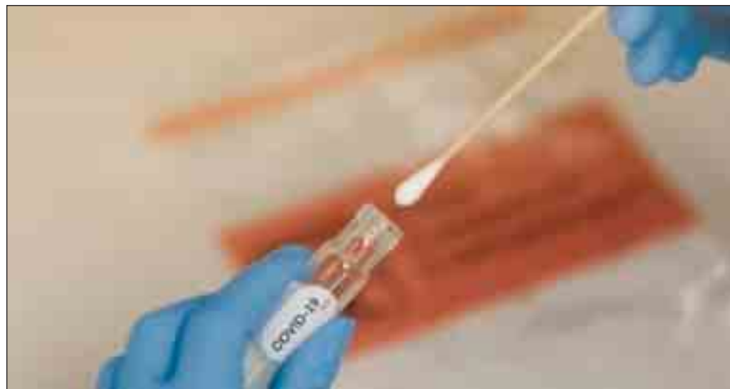
Un tampone Covid

Monitoraggio nella settimana dal 21 al 27 dicembre: un dato che nel 2023 non si era mai visto