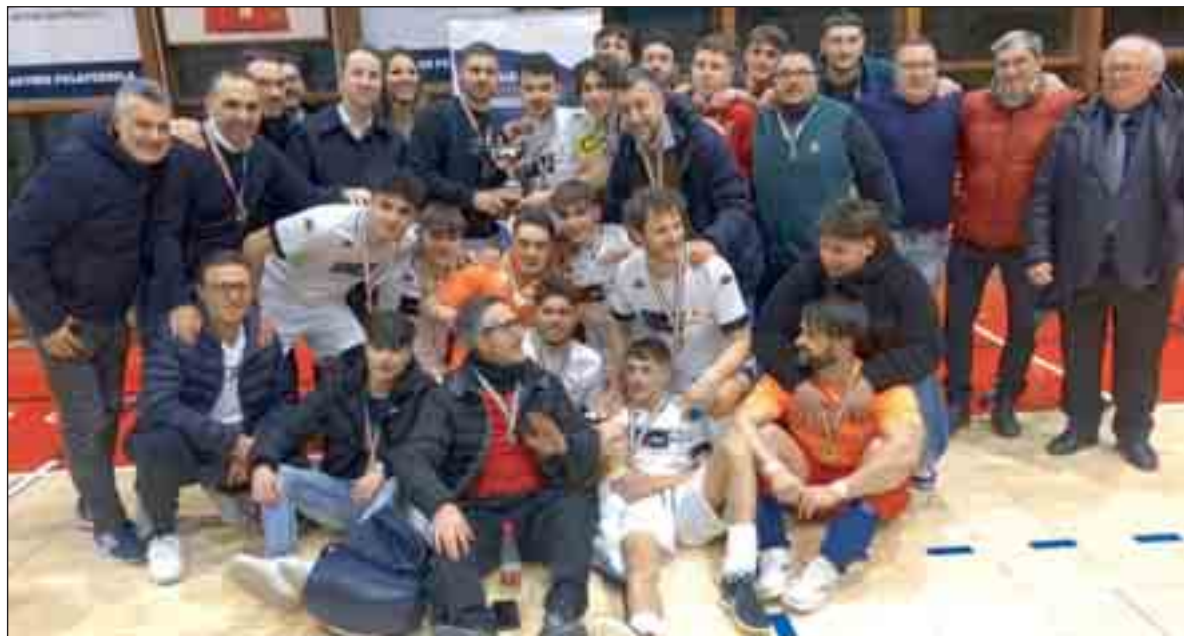
Nella foto a sinistra, il Ferrandina dopo la conquista della Coppa Italia

Gli aragonesi si aggiudicano la Coppa Italia regionale: battuto in finale il Gema per 7-1