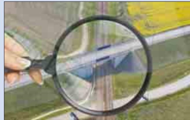
Il progetto di Rete ferroviaria italiana

della circolazione ferroviaria e della sicurezza stradale, andando incontro alle esigenze di mobilità dei cittadini e di ricucitura del tessuto urbano, espresse dal territorio. Il progetto recepisce le prescrizioni dei Comuni di Barile, Rionero in Vulture e del ministero della Cultura e prevede la realizzazione di un viadotto ad archi, una importante opera di scavalco della linea ferroviaria, con 5 campate di luce pari a circa 20 metri, la modifica di alcune viabilità (la ex Ss 93 nel tratto che collega Rionero e Barile, la via Padre Pio