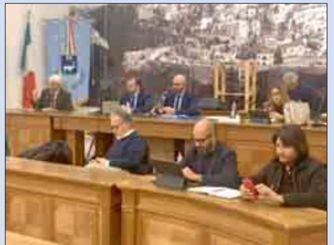
Consiglio comunale di Matera

grammato per il 2024. "La spesa in conto capitale - fanno sapere - è stata programmata attingendo per il 75% da contributi statali ed europei, in modo da utilizzare finanziamenti esterni per la realizzazione di opere pubbliche, senza gravare sulla cassa comunale. Gli sforzi compiuti negli anni covid e in quest'ultimo, dove si è dovuto far quadrare la spesa nonostante l'inflazione - dichiarano -, ci hanno permesso di gestire la spesa