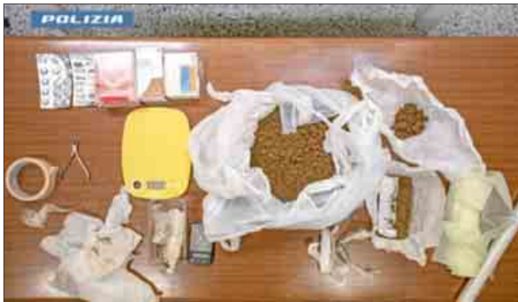
La droga rinvenuta e sequestrata a casa del giovane materano

MATERA - Gli agenti della polizia di Matera hanno arrestato in flagranza un giovane materano, per il reato ipotizzato di detenzione ai fini di spaccio di sostanze stupefacenti. Notevole il quantitativo di droga sequestrata, pari a un chilo e 491 grammi di hashish, oltre a 2 grammi di cocaina. Durante le attività di controllo del territorio, gli investigatori hanno notato un'autovettura che li ha insospettiti: pertanto, hanno iniziato a seguirla. Dopo aver compiuto alcuni giri in città, l'auto ha imboccato improvvisamente la strada in direzione Altamura, per poi ritornare nel capoluogo, trascorso un po' di tempo. Gli agenti hanno allora deciso di procedere a una verifica, fermando il veicolo. In quel momento, il passeggero, 22enne, avrebbe cercato di disfarsi di due involucri, lasciandoli cadere sul tappetino all'interno dell'abitacolo. Il gesto non è sfuggito ai poliziotti, i quali hanno recuperato i due involucri, notando che contenevano cocaina. L'at-