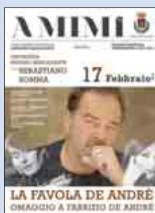
La locandina dell'evento di stasera