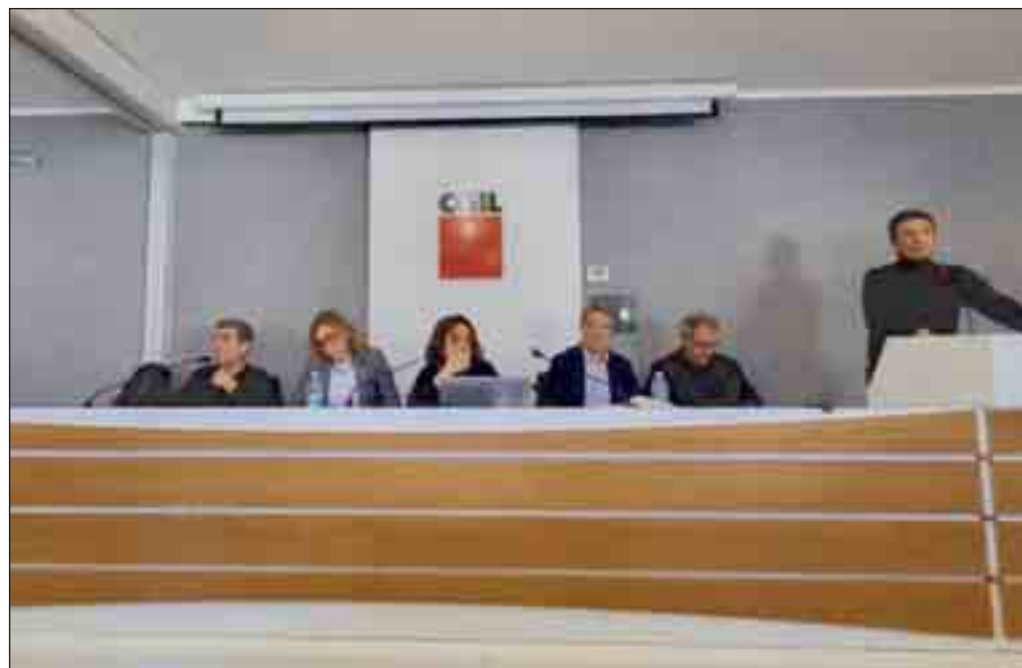
L'assemblea di ieri mattina della Cgil Basilicata

POTENZA - La tragedia di ieri mattina a Firenze, dove tre operai (bilancio purtroppo non definitivo) hanno perso la vita dopo il crollo in un cantiere per la realizzazione di un supermercato, ha nuovamente portato in primissimo piano il tema della sicurezza sul lavoro. Al netto degli appelli, delle campagne di sensibilizzazione, delle attività di prevenzione e repressione, di lavoro, purtroppo si continua a morire. E i sindacati sono pronti ad una nuova mobilitazione. Dopo il tragico incidente in Toscana,