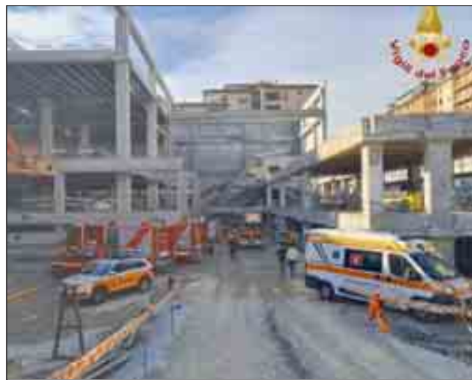
Le immagini del crollo di ieri mattina a Firenze in un cantiere per la realizzazione di un supermercato: tre le vittime accertate

feriti e delle malattie professionali". In Basilicata il bilancio dell'anno che ci siamo da poco lasciati alle spalle parla di dieci vittime sul lavoro, quasi una al mese in media. Numeri davvero preoccupanti per una piccola regione come la nostra che, non a caso, si piazza ai primissimi posti della triste graduatoria nazionale