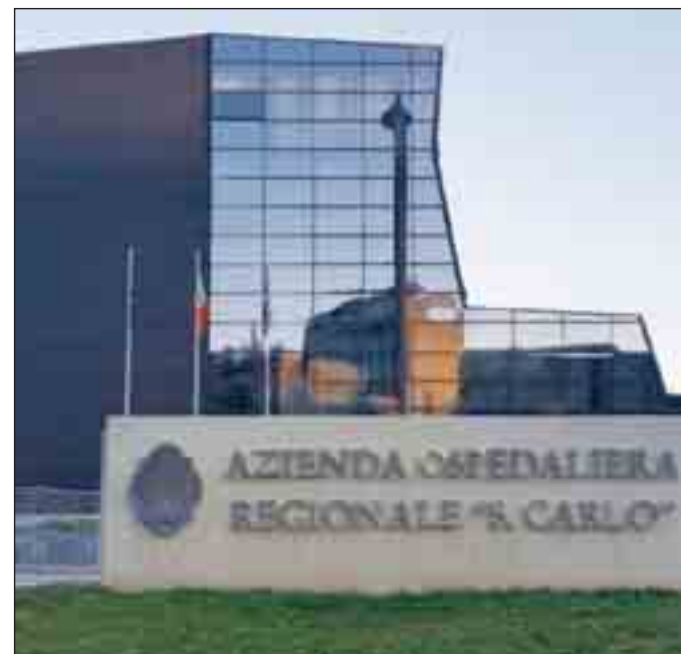
L'azienda ospedaliera San Carlo e l'audizione della Uil Fpl

graduatorie. La Uil Fpl si augura che sia veramente così poiché se guardiamo ai numeri comunicati dalle singole Aziende, non si riesce a coprire tutte le platee degli Oss, infermieri, delle Ostetriche ovviamente speriamo che l'assessore abbia ragione e che i direttori generali tornino indietro in modo da chiudere definitivamente questa vertenza. Nel ringraziare ancora una volta la IV Commissione per l'ascolto la stessa si è impegnata a farsi portavoce con la Regione e l'Azienda S. Carlo ed invierà una nota accompagnata dai verbali della riunione”.