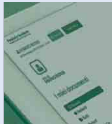
Il fascicolo sanitario elettronico della Regione Basilicata

POTENZA - In ottemperanza al recente decreto ministeriale del 7 settembre 2023, visto il parere favorevole del Garante per la Protezione di Dati Personali, la Regione Basilicata ha annunciato oggi l'aggiornamento dell'informativa sulla privacy relativa al Fascicolo Sanitario Elettronico (FSE). Questa importante revisione mira a rafforzare ulteriormente la tutela della privacy e la sicurezza dei dati sanitari degli utenti, in linea con i più alti standard previsti dalla normativa vigente.