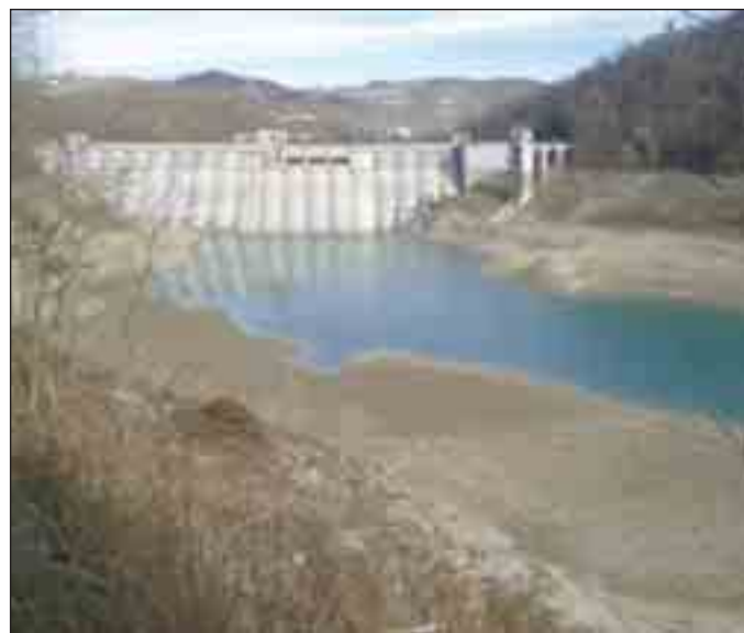
La diga di Montecotugno, uno degli invasi lucani che nel confronto con lo scorso anno fa registrare cali consistenti di acqua

POTENZA - Le stazioni del Servizio Agrometeorologico Lucano (SAL) gestite dall'Alsia hanno registrato in questi giorni sino a 39,8 gradi a Pisticci, 39,7 gradi a Bernalda, 37,9 gradi a Gaudiano-Lavello. Il caldo è diventato rovente. A risentirne in primo luogo l'agricoltura innanzitutto per l'irrigazione. In una sola settimana di grande caldo, in Basilicata gli invasi sono calati di oltre 20 milioni di metri cubi di acqua, elevando il deficit sul 2023 a quasi 193 milioni. E' la fotografia delle principali dighe lucane che attualmente contengono 296 milioni di metri cubi di risorsa idrica, rispetto ai 489 di dodici mesi fa. In particolare, secondo i dati forniti dall'Ente per lo Sviluppo dell'Irrigazione e la Trasformazione Fondiaria in Puglia, Lucania e Irpinia, il calo maggiore lo si registra nell'invaso di Montecotugno dove sono invasati 166 milioni di metri cubi, quasi 117 in meno rispetto ad un anno fa. Nella diga del Pertusillo sono contenuti quasi 95 milioni di metri cubi di acqua, 19 in meno rispetto a dodici mesi fa. Poco più 22 milioni di metri cubi, invece, quelli presenti nell'invaso di San Giuliano, rispetto ai 69 dello stesso periodo del 2023. Una situazione definita drammatica dalle associazioni di categoria agricole.