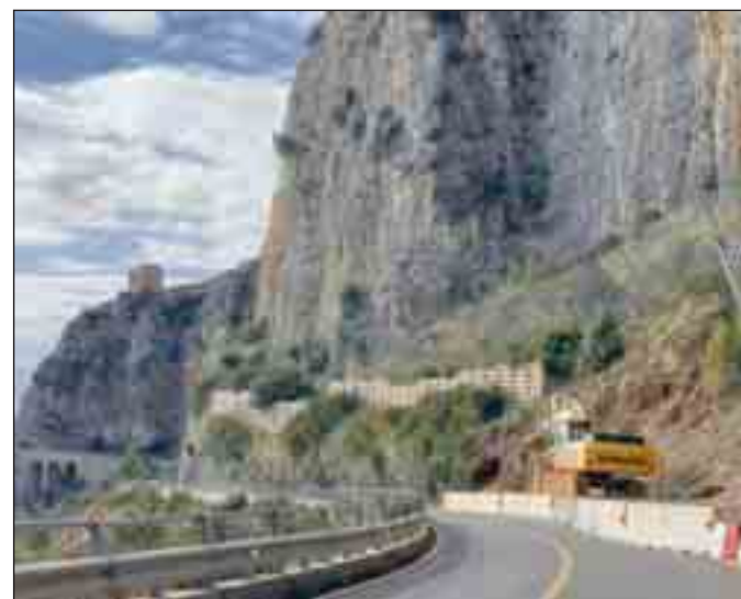
La strada statale 18 che conduce a Maratea dopo la frana del 2022

periodo di chiusura, tra cui l'allungamento di un 'paramassi' ed altri interventi di sicurezza, dovrebbero essere sufficienti. L'obiettivo da perseguire - continua - dovrebbe essere solo quello di favorire la ripresa delle imprese turistiche che hanno chiuso in rosso la stagione 2023". L'impegno del consorzio, inoltre, è di sostenere l'iniziativa del nuovo sin-