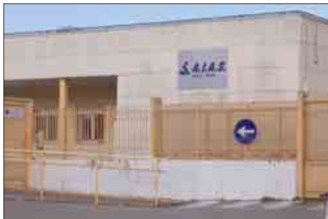
La sede dell'Aias a Potenza

Anche per i lavoratori dell'Aias di Potenza, come