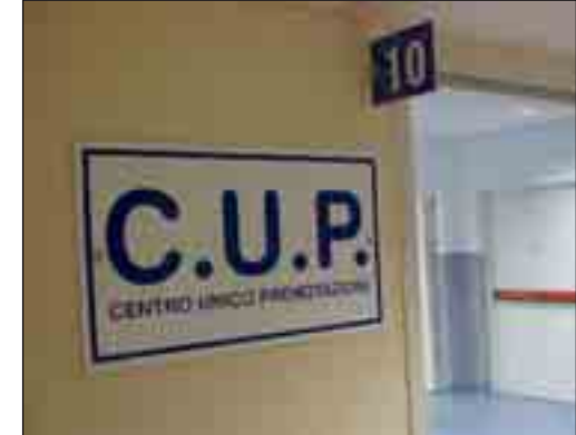
Il centro unico di prenotazione. A PAGINA 5

Sanità in "rosso" Ennesima bocciatura per il servizio sanitario lucano Il centro Crea dà i voti: "Vale meno di cinque"