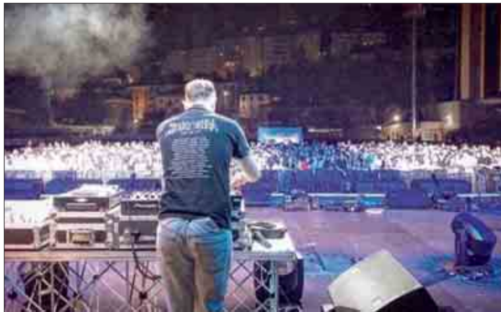
Alcuni momenti della serata giovedì sera al Viviani

POTENZA - Grande successo giovedì sera al Viviani per Teenage Dream, il party generazionale all'insegna del divertimento. Un viaggio musicale tra le canzoni e le coreografie che tengono compagnia per tutta l'adolescenza, fino ad arrivare alle sigle dei cartoni più amati e famosi, che hanno coinvolto grandi e piccoli.