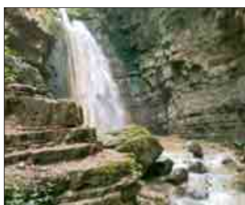
Altri due momenti delle escursioni organizzate dall'Asd Sentieri

dei parchi e delle riserve naturali, esplorando e raggiungendo le mete più panoramiche, conoscendo le tradizioni e la cultura rurale e assaporando i sapori di una volta in percorsi enogastronomici. La diffusione degli sport outdoor, in ambiente esterno, principalmente montano, sono l'obiettivo principale della Asd Sentieri. L'unico vero